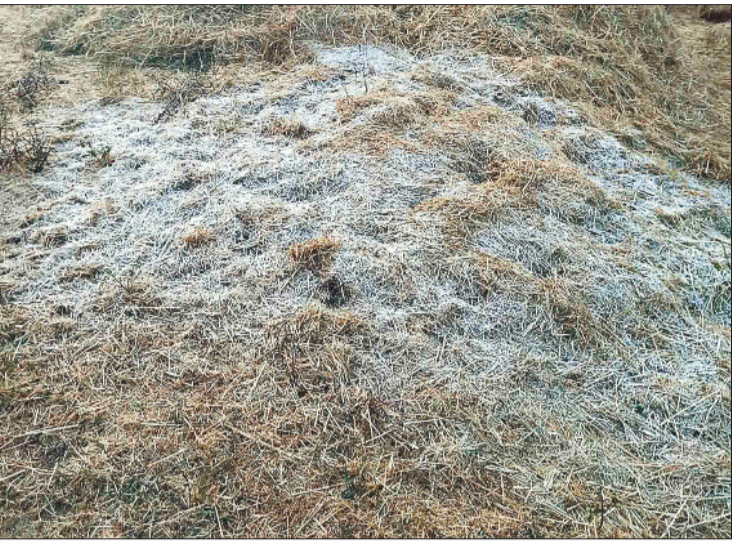
परा के ऊपर जमा पाला।

पिछले दो दिनों से शहर सहित पूरा सरगुजा संभाग शीतलहर की चपेट में है। राजस्थान के रेगिस्तान से लगातार पहुंच रही शुष्क वर्षा हिमालय से टकराने के बाद बर्फ की ठंडक लेकर पहुंच रही सर्द हवाओं ने कंपकपी बढ़ा दी है। हालत यह है कि वातावरण की नमी सूखने से शुष्कता बढ़ते जा रही है जिससे खुले स्थानों पर कड़ाके की ठंड लग रही है घरों के भीतर भी ठंड से राहत नहीं मिल रही है। वातावरण में कनकनी की मात्रा बढ़ने के कारण दिन में भी लोगों को गर्म कपड़ा पहनना पड़ रहा है। शीत लहर का प्रभाव पड़ोसी राज्य उत्तर प्रदेश एवं मध्यप्रदेश में भी देखा जा रहा है। शीत लहर के प्रभाव से वातावरण की आर्द्रता 30-32 फीसदी के मध्य पहुंच गई जो दो दिन पूर्व