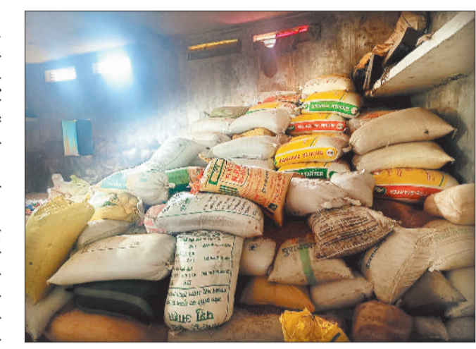
जब्त धान। एसडीएम केलहारी के निर्देश पर तहसील प्रशासन, खाद्य विभाग और राजस्व अमले की संयुक्त टीम ने यह कार्रवाई की। जांच के दौरान पाया गया कि उक्त धान बिना वैध दस्तावेजों के संग्रहित किया गया था तथा खरीदी केन्द्र के आसपास अनुचित तरीके से रखा गया था।